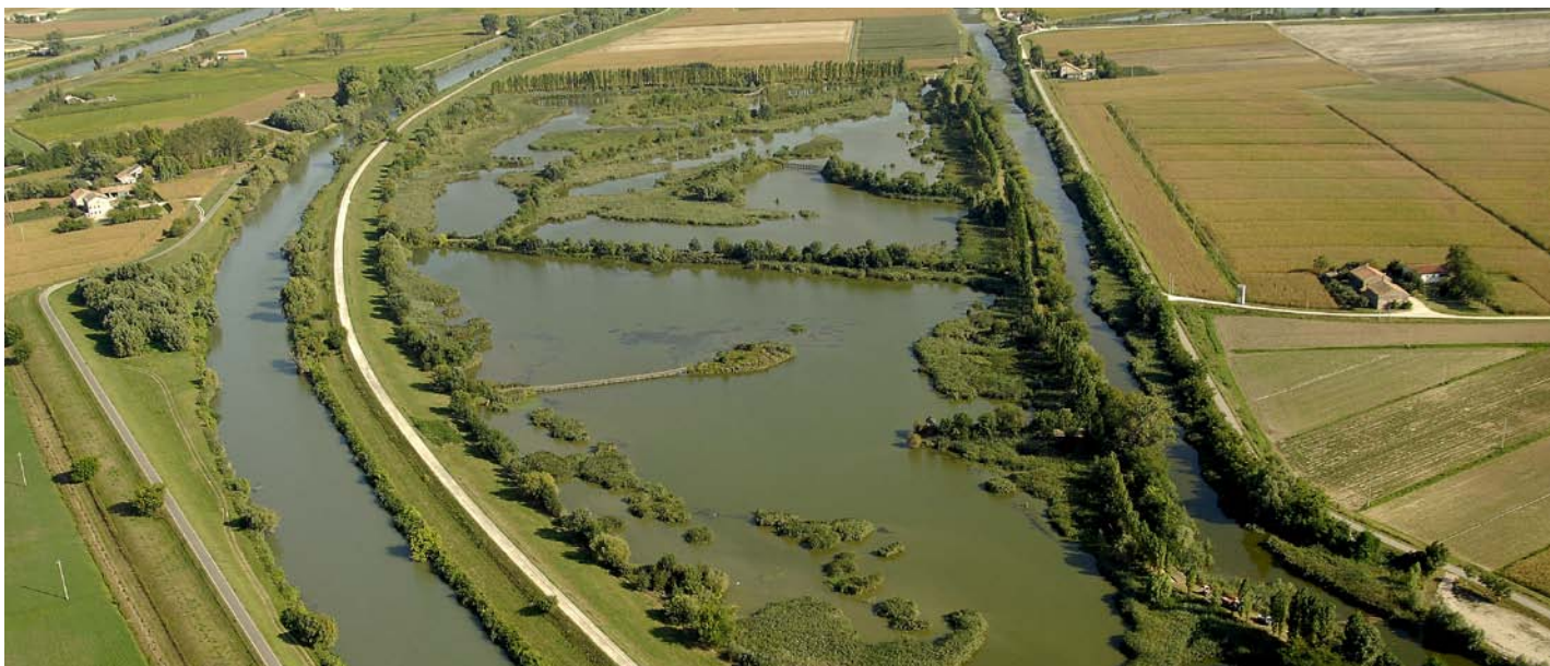
Bacino di Cà di Mezzo, Codevigo