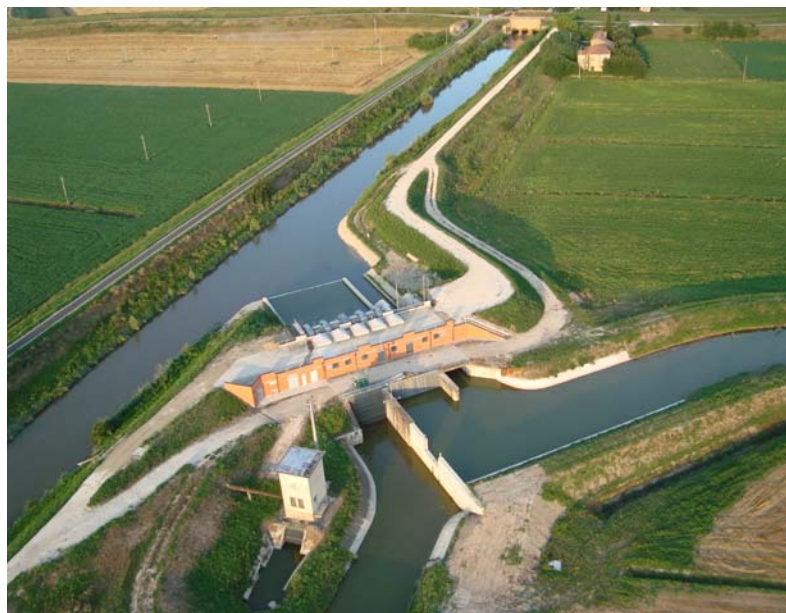
Idrovora nuova Frattesina