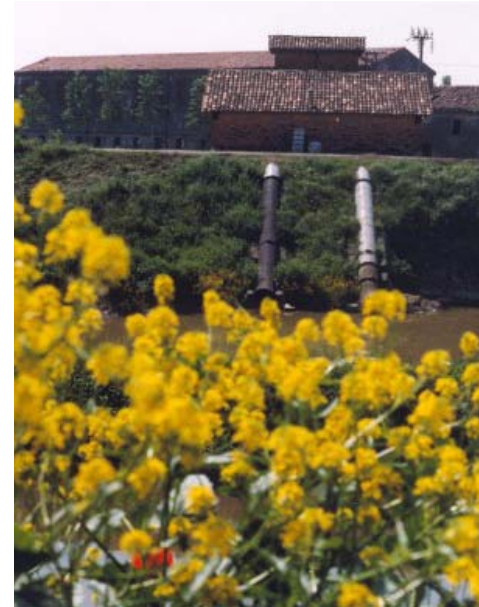
Idrovora Frattesina, Vighizzolo d'Este