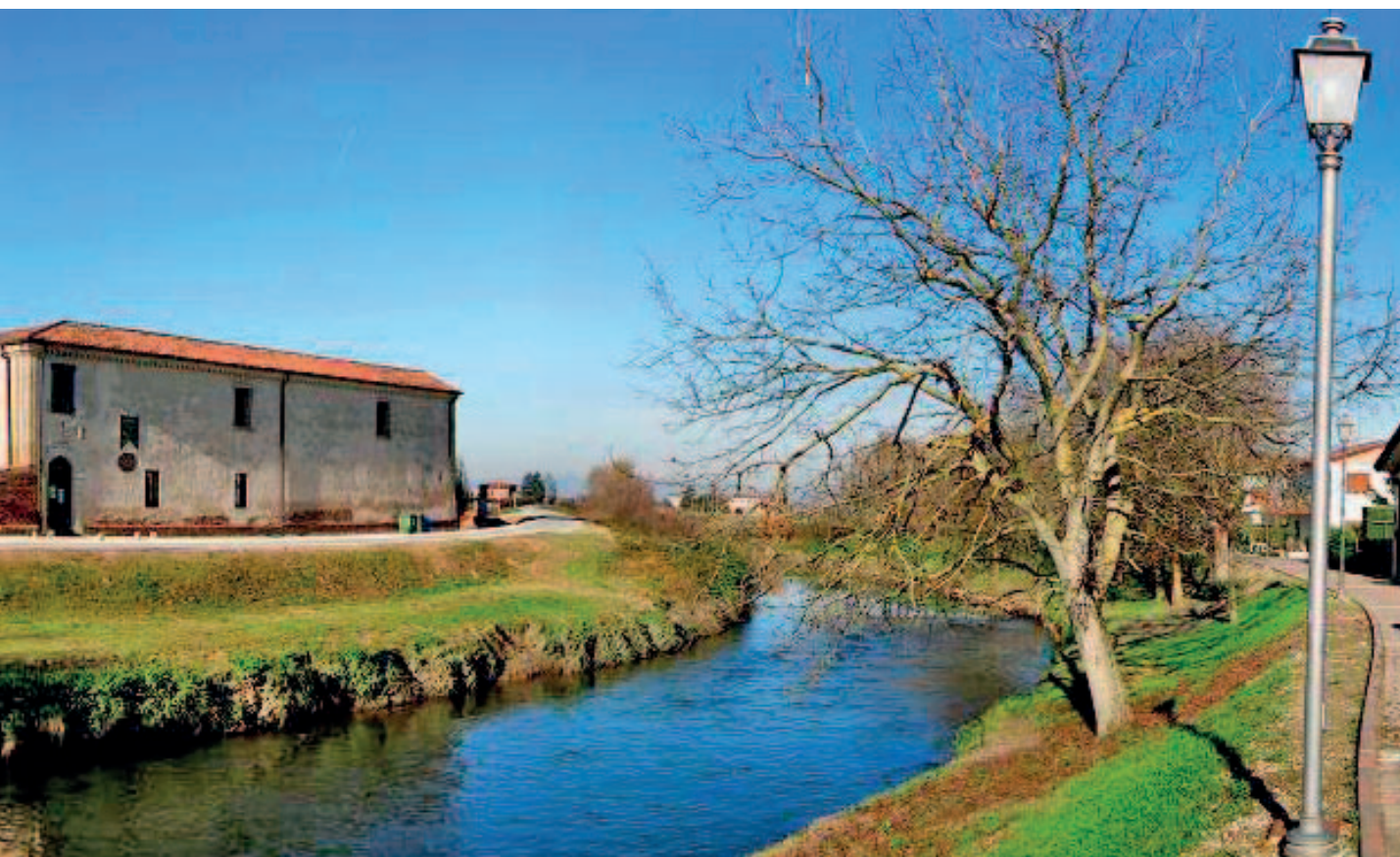
Monastero di San Salvaro ad Urbana – Rive Fiume Fratta