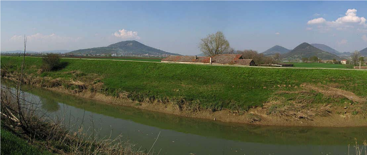
Fiume Frassine - Este