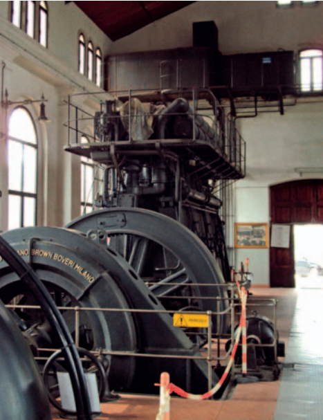
Idrovora Barbegara, Correzzola