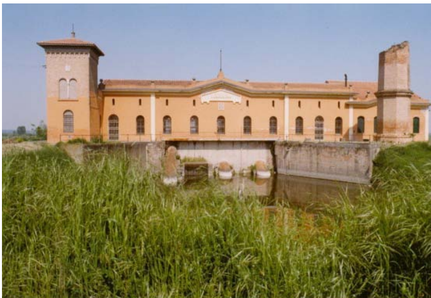
Idrovora Vampadore, Megliadino S. Vitale