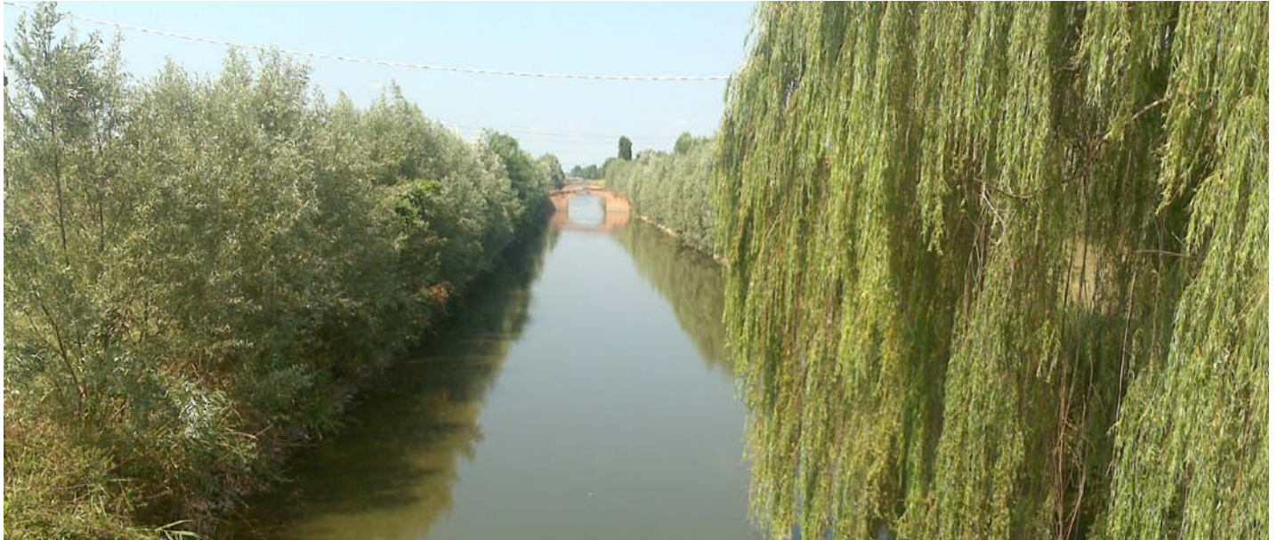
Canale Altipiano, Codevigo