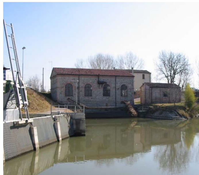
Idrovora Acquanera, Pernumia