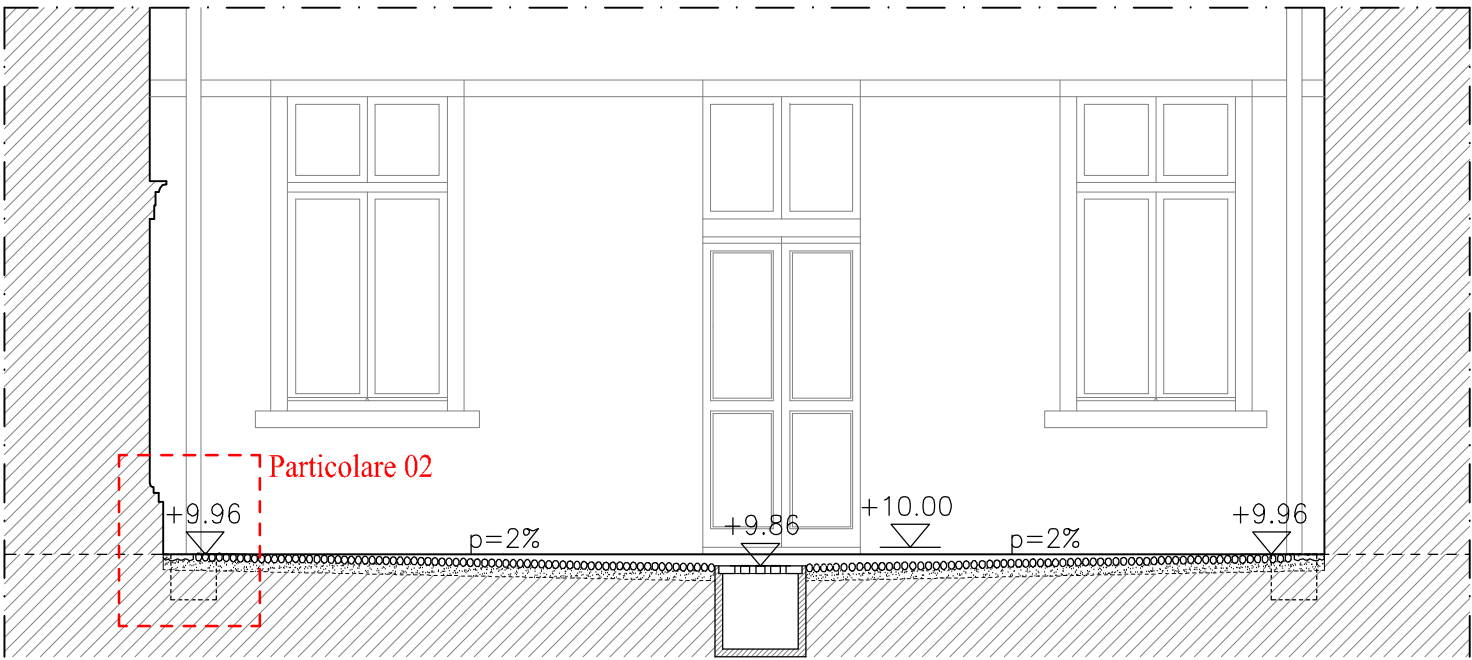
Sezione A-A scala 1:50

Pluviale in lamiera di rame diam. mm 100